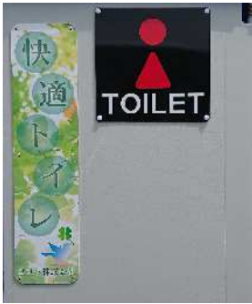
①大型ピクトサイン