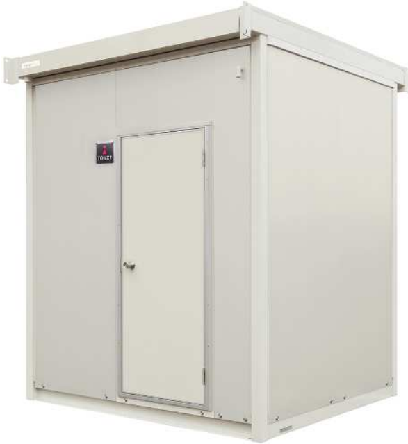
W2270×D1970×H2700/重量約710kg 給水タンク40L/便槽140L