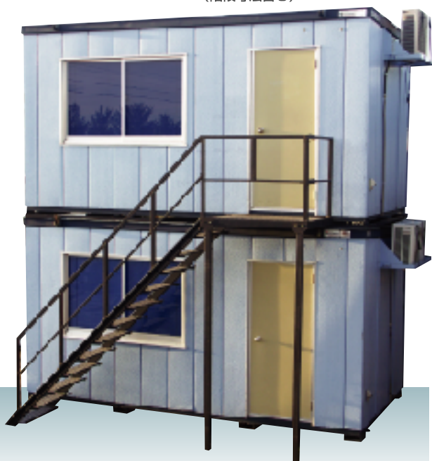
※1階は倉庫としても使えます。